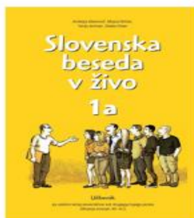
Slovenska beseda v živo 1a