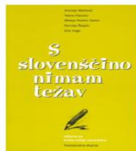
S slovenščino nimam težav