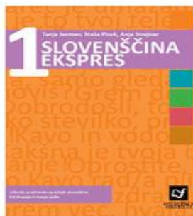
Slovenščina ekspres 1