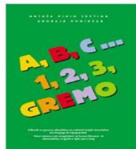
A, B, C ... 1, 2, 3, gremo – za govorce albanščine