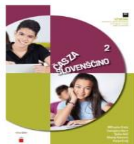
Čas za slovenščino 2