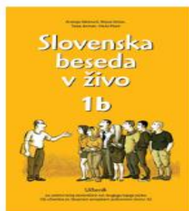
Slovenska beseda v živo 1b