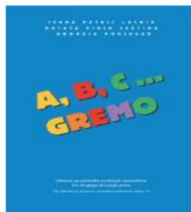
A, B, C ... gremo